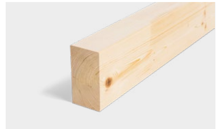
Konstruktionsvollholz & GLT®